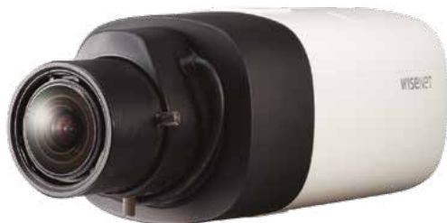
* Без объектива